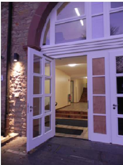
Keine heilige Pforte – aber offen für junge Menschen: Tortür zum Stephanushaus im Jugendhaus Hardehausen.

Drei päpstliche Hammerschläge! Diese Bilder werden um die Welt gehen! Ein markantes Zeremoniell! Mit der Öffnung der symbolisch vermauerten Heiligen Pforte im Petersdom beginnt das Heilige Jahr. Papst Franziskus wird es am 8. Dezember feierlich eröffnen. Erstmals nicht nur in Rom. Später werden weitere Heilige Pforten nicht nur in den römischen Papstbasiliken, sondern in wichtigen Kirchen auch in den deutschsprachigen Bistümern geöffnet. Es soll das Jahr der Barmherzigkeit werden, es ist das Herzensthema von Papst Franziskus. Barmherzigkeit soll sich in den eigenen Ortskirchen geistlich entfalten und wirksam werden. Und das Handeln dafür geschieht draußen vor und an den Rändern der Städte, der Gesellschaft. Das Bild offener Kirchentüren spricht für sich: Sie sind eine Einladung an alle Menschen dar, die auf der Suche nach Sinn und Orientierung sind. Oder wie es im Gebet zur Öffnung der „Pforten der Barmherzigkeit“ in den Ortskirchen heißt: